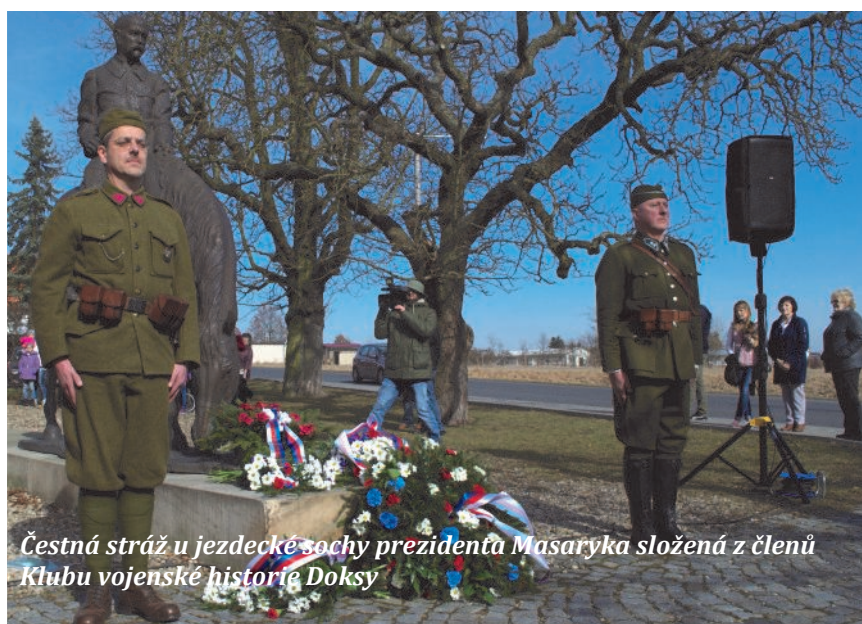
Čestná stráž u jezdecké sochy prezidenta Masaryka složená z členů Klubu vojenské historie Doksy

čímž této společnosti ještě jednou děkujeme za podporu. Dále všichni přítomní obdrželi od místopředsedy Spolku pro zachování odkazu českého odboje, Pamětní listy, jako malou vzpomínku na uskutečněné společné setkání. Věříme, že do budoucna nás čeká takových milých setkání ještě mnoho.