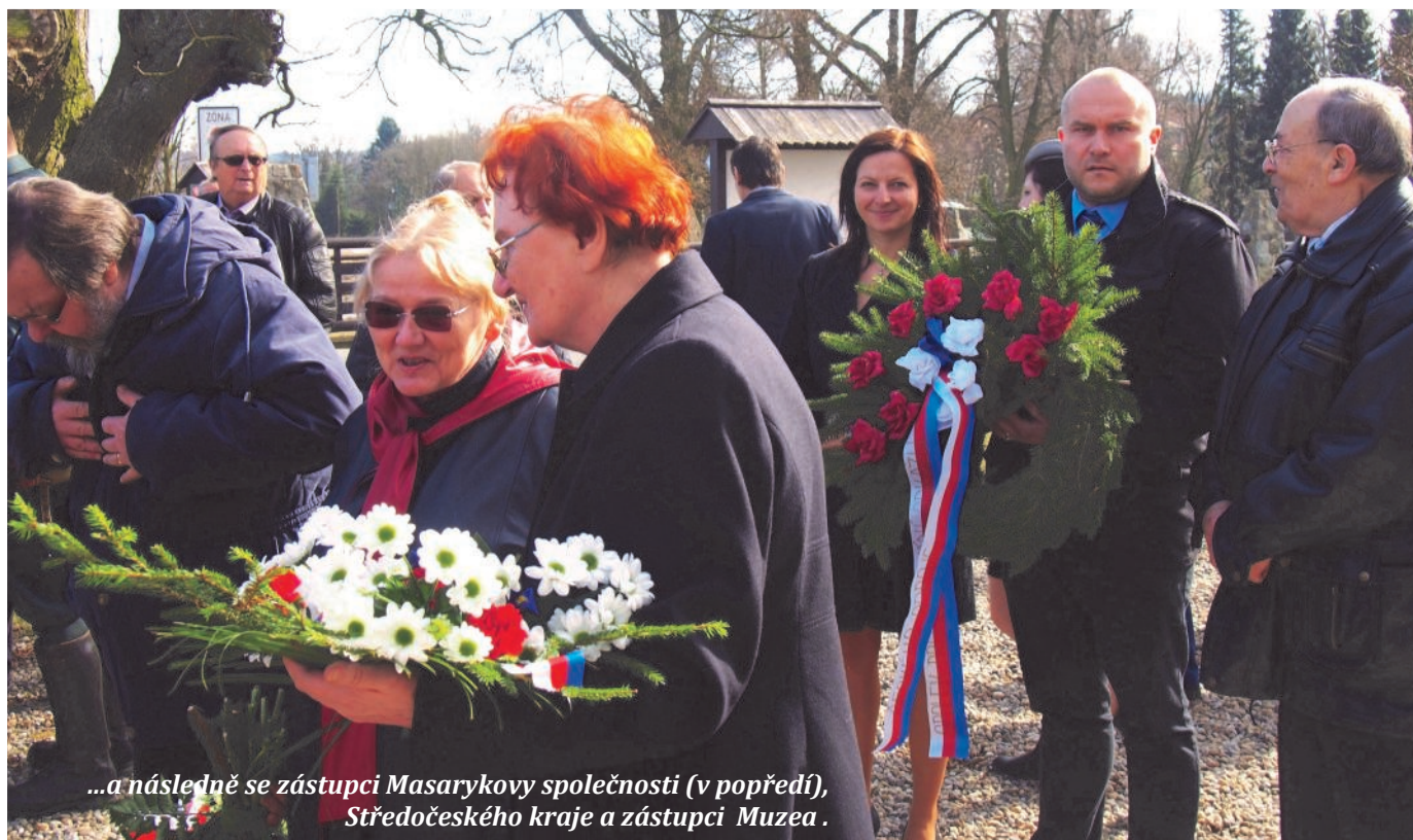
...a následně se zástupci Masarykovy společnosti (v popředí), Středočeského kraje a zástupci Muzea .

pravili malé překvapení v podobě kapesních diářů a stolních kalendářů, které jsme obdrželi darem od společnosti Presco Group, s.r.o.,