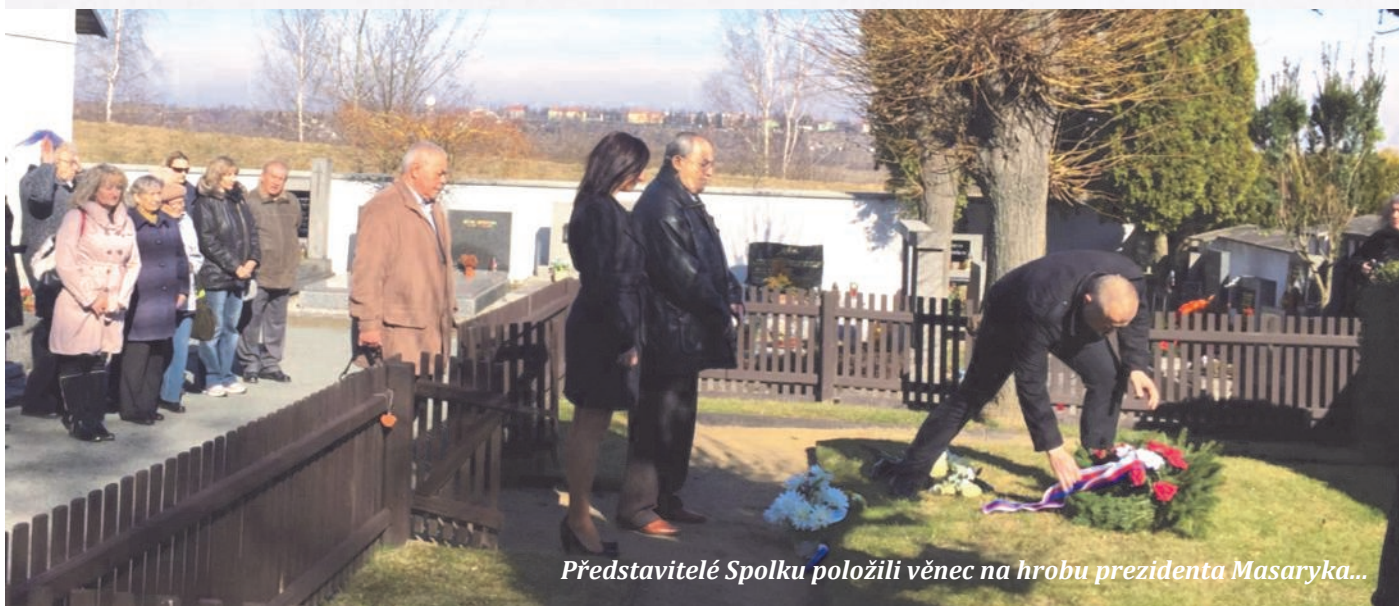
Představitelé Spolku položili věnec na hrobu prezidenta Masaryka...

U příležitosti 167. výročí narození prvního československého prezidenta Tomáše Garrigue Masaryka, jsme v sobotu 4. března 2017 uskutečnili návštěvu Lán v rámci akce Den s T.G.M. , kterou organizovalo Muzeum T. G. Masaryka v Lánech. Spolek pro zachová-