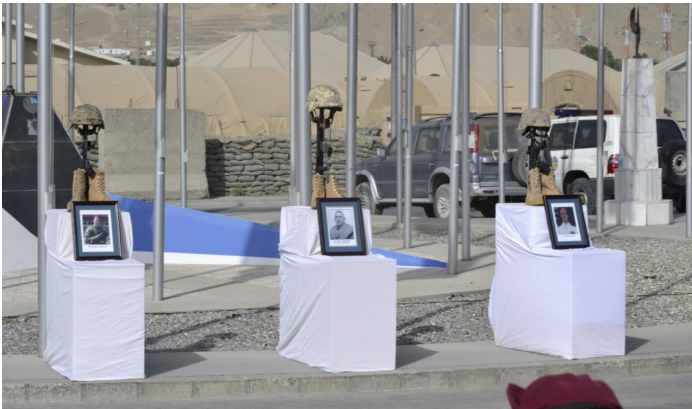
Foto dole: pietní akt na základně KAIK (Kabul International Airport) - rozloučení s padlými koaličními vojáky.