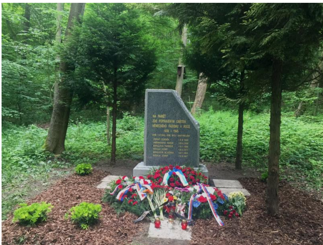
Foto nahoře a dole: Současný stav pomníku - práce bojovníků a kamenic- tví Petra Pokorného.

Uplynulo 73 let od popravy českých vlastenců, 70 let od exhumace těl a převezení do rodinných hrobek v rodišti a 1 rok od péče OV ČSBS