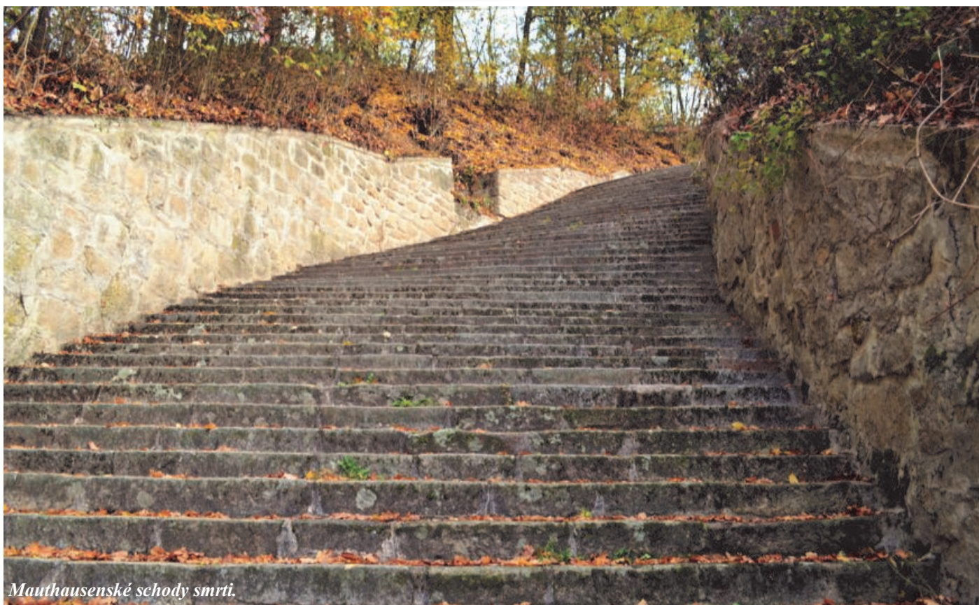
Mauthausenské schody smrti.