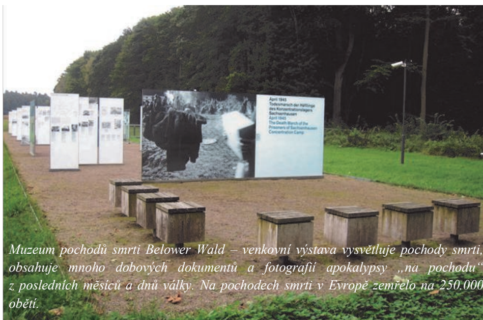
Muzeum pochodů smrti Belower Wald – venkovní výstava vysvětluje pochody smrti, obsahuje mnoho dobových dokumentů a fotografií apokalypsy „na pochodu“ z posledních měsíců a dnů války. Na pochodech smrti v Evropě zemřelo na 250.000 obětí.