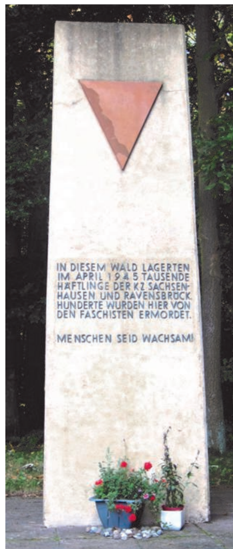
Muzeum Belower Wald - pomník obětem pochodu smrti byl postaven v roce 1975. Za pomníkem se nachází část lesa u Belowa, kde lze nalézt památky na pobyt 16.000 vězňů v dubnu roku 1945 – oloupanou kůru stromů, nápisy na stromech, vykopané mělké zmljanky, rekonstrukce přístřešků z větví a listí.