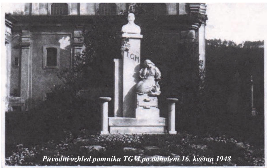
Původní vzhled pomníku TGM po odhalení 16. května 1948