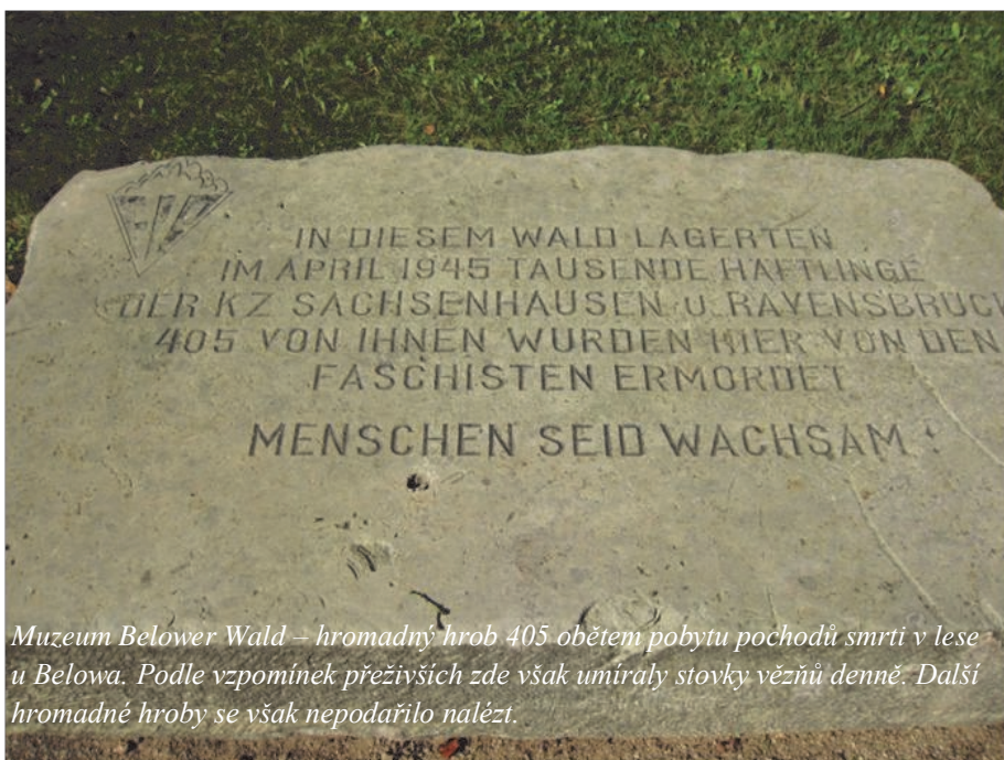
Muzeum Belower Wald – hromadný hrob 405 obětí pobytu pochodů smrti v lese u Belowa. Podle vzpomínek přeživších zde však umíraly stovky vězňů denně. Další hromadné hroby se však nepodařilo nalézt.

narychlo zřízeného lazaretu přesunuti někteří nemocní vězni. Červený kříž dodal i balíky s potravinami – nicméně dalšímu pokračování pochodu smrti nezabránil. 29.dubna byly hnány tisíce vězňů dále. Až mezi 2. až 6.květnem byli osvobozeni v prostoru Parchim-Ludwigslust-Schwerin.