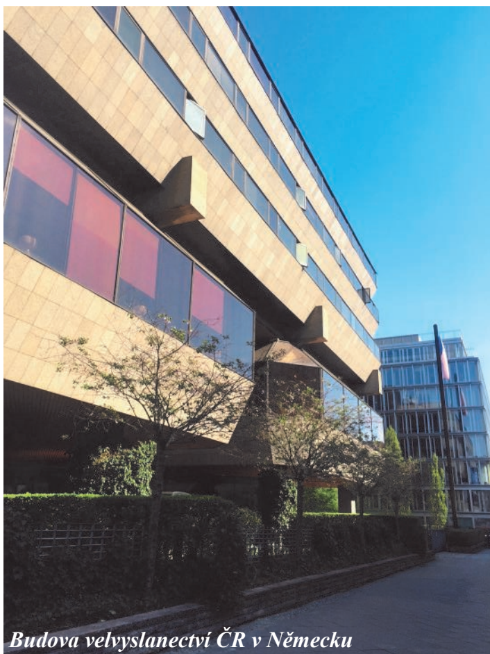
Budova velvyslanectví ČR v Německu