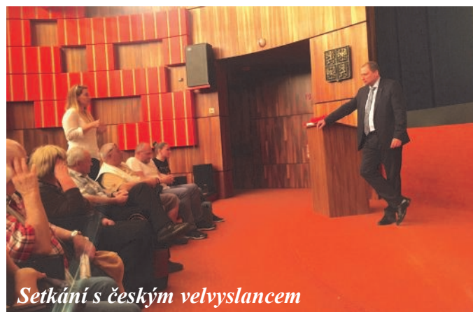
Setkání s českým velvyslancem