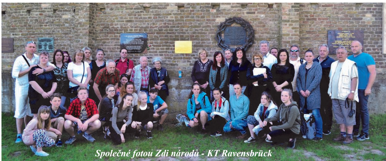
Společné fotou Zdi národů - KT Ravensbrück