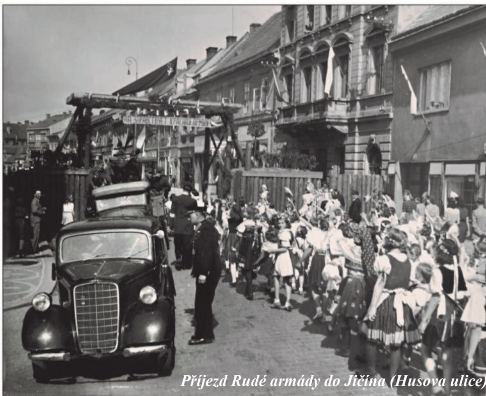
Příjezd Rudé armády do Jičína (Husova ulice)