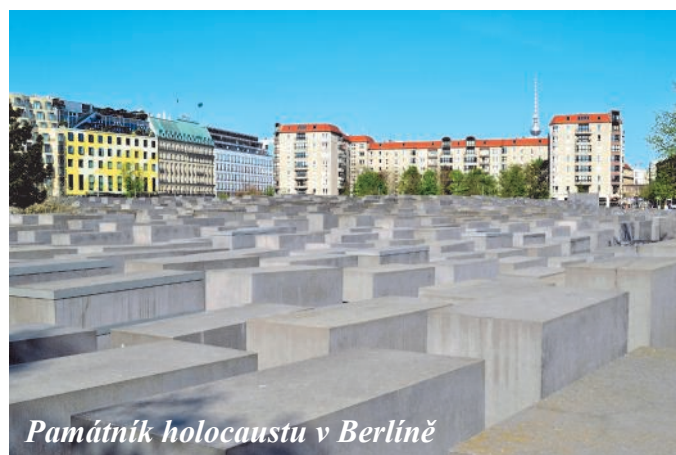
Památník holocaustu v Berlíně

Od pátku 20. dubna do neděle 22. dubna 2018 uspořádal Spolek pro zachování odkazu českého odboje zájezd do koncentračních táborů Ravensbrück a Sachsenhausen.