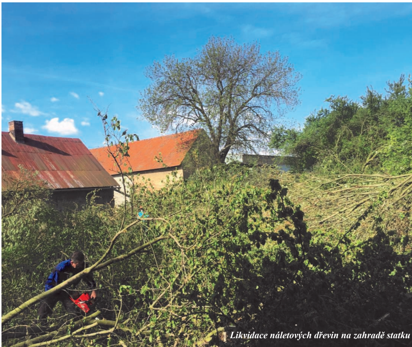
Likvidace náletových dřevin na zahradě statku

Více než tři desítky dobrovolníků se sešlo poslední dubnovou sobotu v Lošanech u Kolína v č.p. 1 na rodném statku generála Josefa Mašína. V loňském roce, po pietní vzpomínce, které jsme se zúčastnili již potřetí, nás napadlo, uspořádat v budoucnu na statku brigádu se členy a případnými dalšími dobrovol-