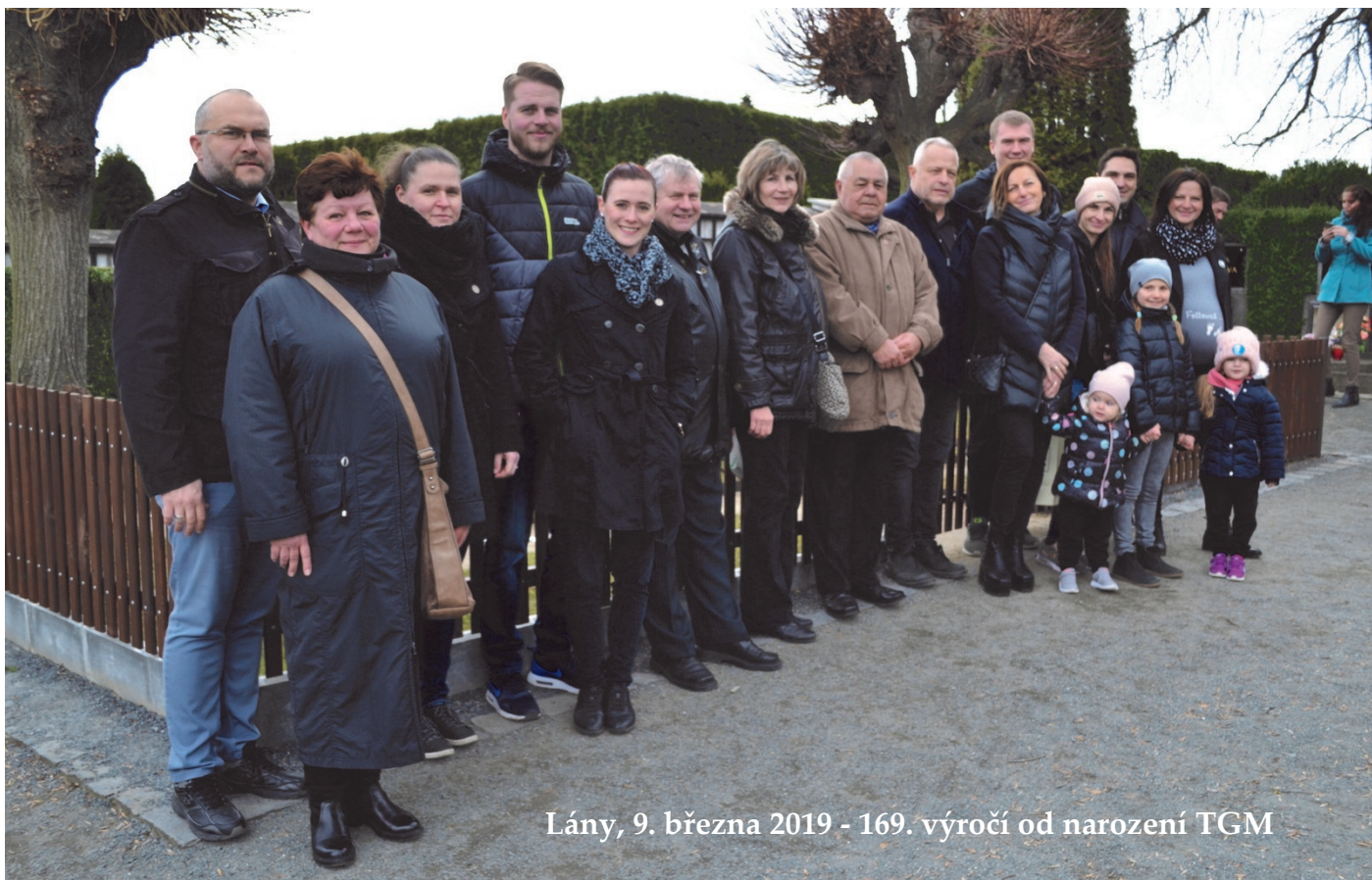
Lány, 9. března 2019 - 169. výročí od narození TGM

V letošním roce jsme si připomněli 169. výročí od narození prezidenta osvoboditele, Tomáše Garrigue Masaryka. Vzpomenout u hrobu TGM v Lánech si přišli členové Spolku hned dvakrát. Poprvé se řada členů zúčastnila oficiálního pietního aktu 7. března v den výročí od narození a uctili tak památku TGM společně s ústavními činiteli, představiteli Československé obce legionářské a se zástupci Sokola. Spolek pro zachování odkazu českého odboje (a předtím OV ČSBS Kladno) si již po několik let připomíná narození TGM o několik dní později v rámci akce DEN S TGM organizované Muzeem T. G. Masaryka v Lánech. V letošním roce však účast na této