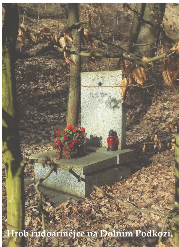
Hrob rudoarmějce na Dolním Podkozí.