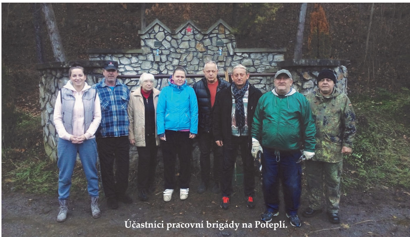
Účastníci pracovní brigády na Poteplí.

Jaro je opět za dveřmi a tak jsme se opět vypravili do terénu. V sobotu 16. března 2019 byl sice deštivý den, přesto nás to neodradilo a v počtu devíti členů jsme se sešli na Poteplí u hrobu rudoarmějců, kteří v těchto místech zahynuli v samém závěru druhé světové války.