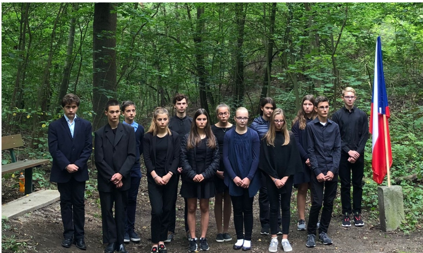
Studenti ZŠ Cyrila Boudy, kteří drží patronát nad pomníkem v Dubí

roveň dbají o to, aby žáci o smutné historii ze září 1944 věděli. Cílem našeho Spolku není k pomníku vozit každý rok byt' naše milé, ale uvědomělé členy, ale naopak - otevírat dveře těm, kteří o historii projeví zájem a je zde i určitá naděje, že v naší činnosti budou jednou pokračovat. Projevilo se to i v letošním roce, když žáci spontánně po skončení aktu přicházeli s nápady, jakým způsobem by mohli další pietní setkání zatraktivnit /například vyrobit modely letadel atd./. Radost jsme měli i z propojení ZŠ Cyrila Boudy v Kladně právě s aktivy z Dubí. Věříme, že příští rok se zúčastní vzpomínky na padlé civilisty zase více občanů města Kladna a vzpomínka na událost, která otřásla tehdejšími obyvateli opět bude živější.